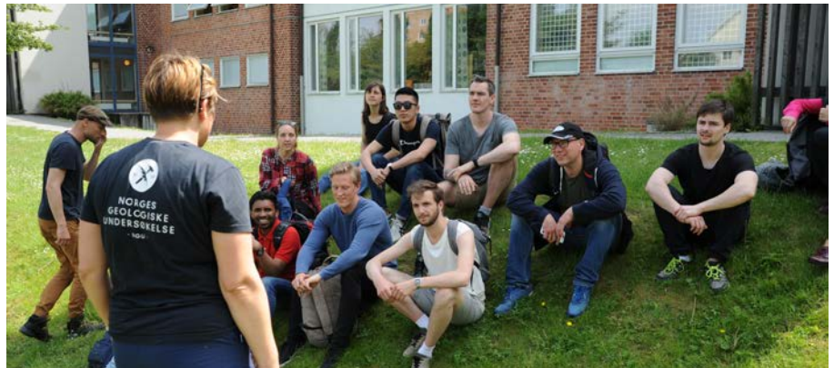
Onderzoek naar de bodemgesteldheid van een wadi tijdens het Climate Café in Malmö.

De onderzoeksresultaten zijn op 16 april 2019 in een workshop met gemeenten, waterschappen en bedrijven besproken. Zij concludeerden onder meer dat onderhoud en monitoring van wadi's essentieel zijn om ongewenst functioneren te voorkomen, met name in situaties waar de infiltratievoorzieningen ook als speelplaatsen voor kinderen worden gebruikt. In de nabije toekomst zal op enkele locaties aanvullend onderzoek naar de omvang van verontreiniging (onder andere diepte en verspreiding en aanvullende stoffen) plaatsvinden. Bij komende workshops en (wetenschap-