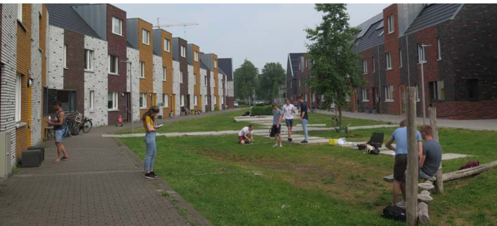
Met de XRF-meettechniek is relatief eenvoudig vast te stellen hoe het zit met de bodemgesteldheid van een wadi.